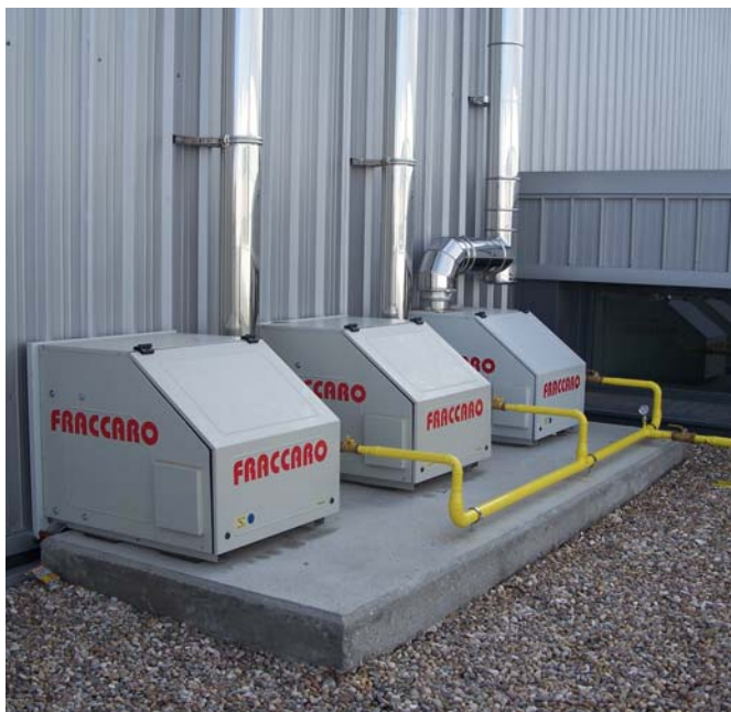
Fig.1 – Quemadores GIRAD en el exterior del polideportivo