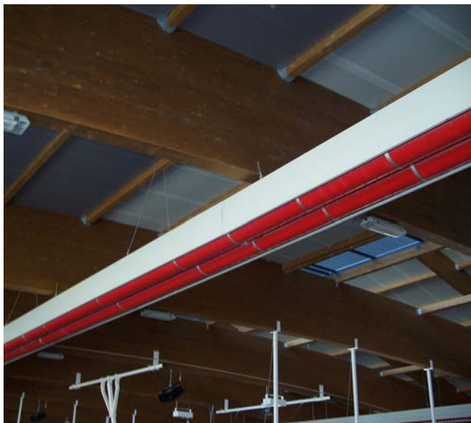
Fig.3 – Detalle conducto radiante GIRAD